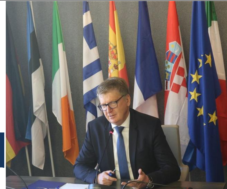
سعادة السفير إيفان سوركوس رئيس البعثة يقدم نظرة عامة على علاقات مصر و الاتحاد الأوروبي

رئيس البعثة سعادة السفير إيفان سوركوس ومختلف أعضاء البعثة قدموا برنامجا شاملا للتعريف بالتعاون المصري الأوروبي