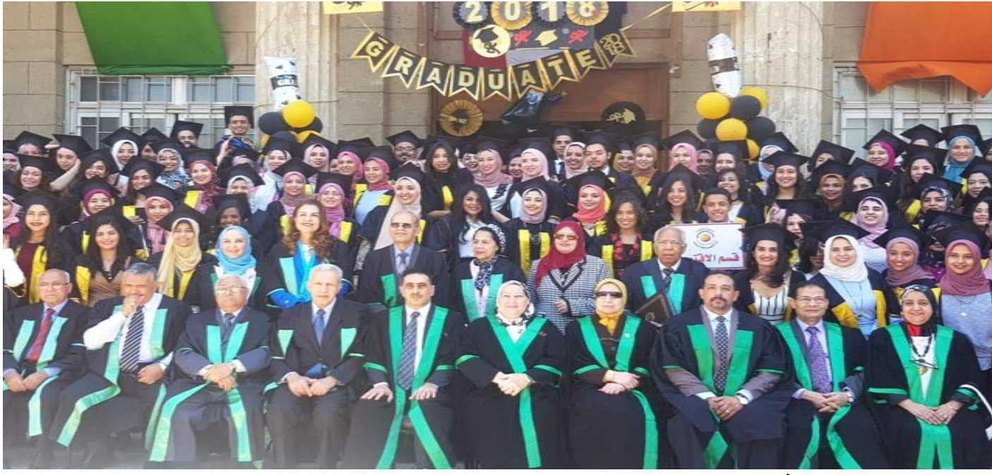
القاهرة: نرمين توفيق

الكلية تخرج دفعة 2018 و تحتفل باليوبيل الذهبي لدفعة 1968 و اليوبيل الفضي لدفعة 1993